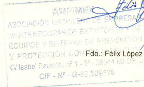
Fdo.: Félix López Gutiérrez